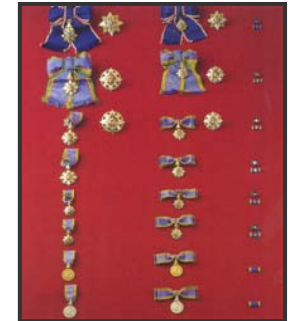
เครื่องราชอิสริยาภรณ์ อันมีเกียรติยศยิ่งมงกุฎไทย

กลุ่มงานทะเบียนประวัติและเครื่องราชอิสริยาภรณ์