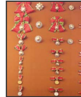
เครื่องราชอิสริยาภรณ์ อันเป็นที่เชิดชูยิ่งข้างเผือก